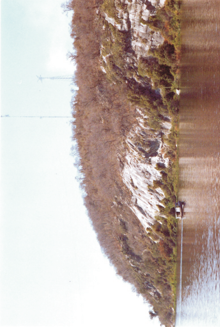
Foto 1: BSEN en cerros calcáreos cercanos a Vallemí (Dpto. Concepción)