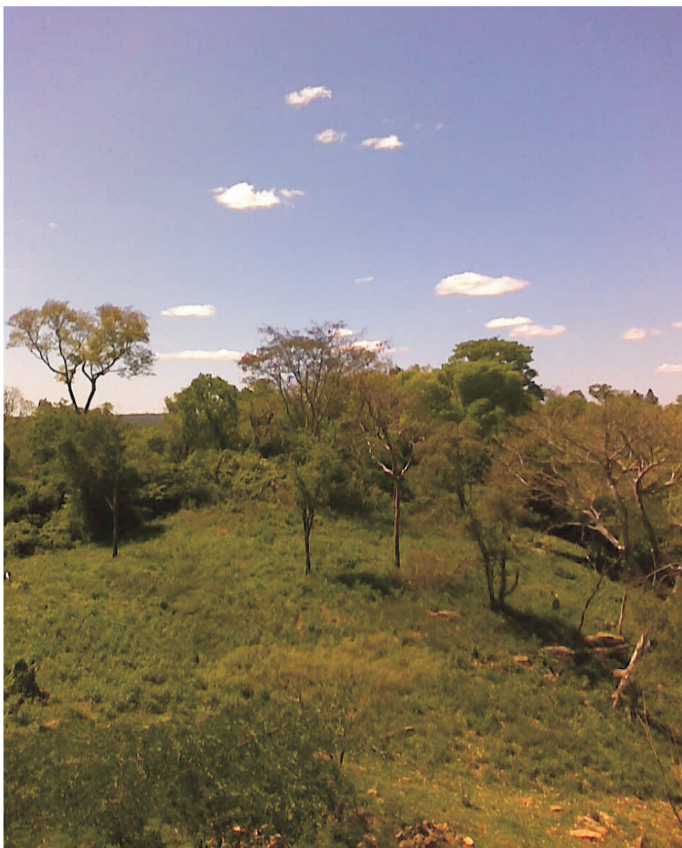
Foto 4: Especies típicas de los BSEN en San Bernardino (Dpto. Cordillera)