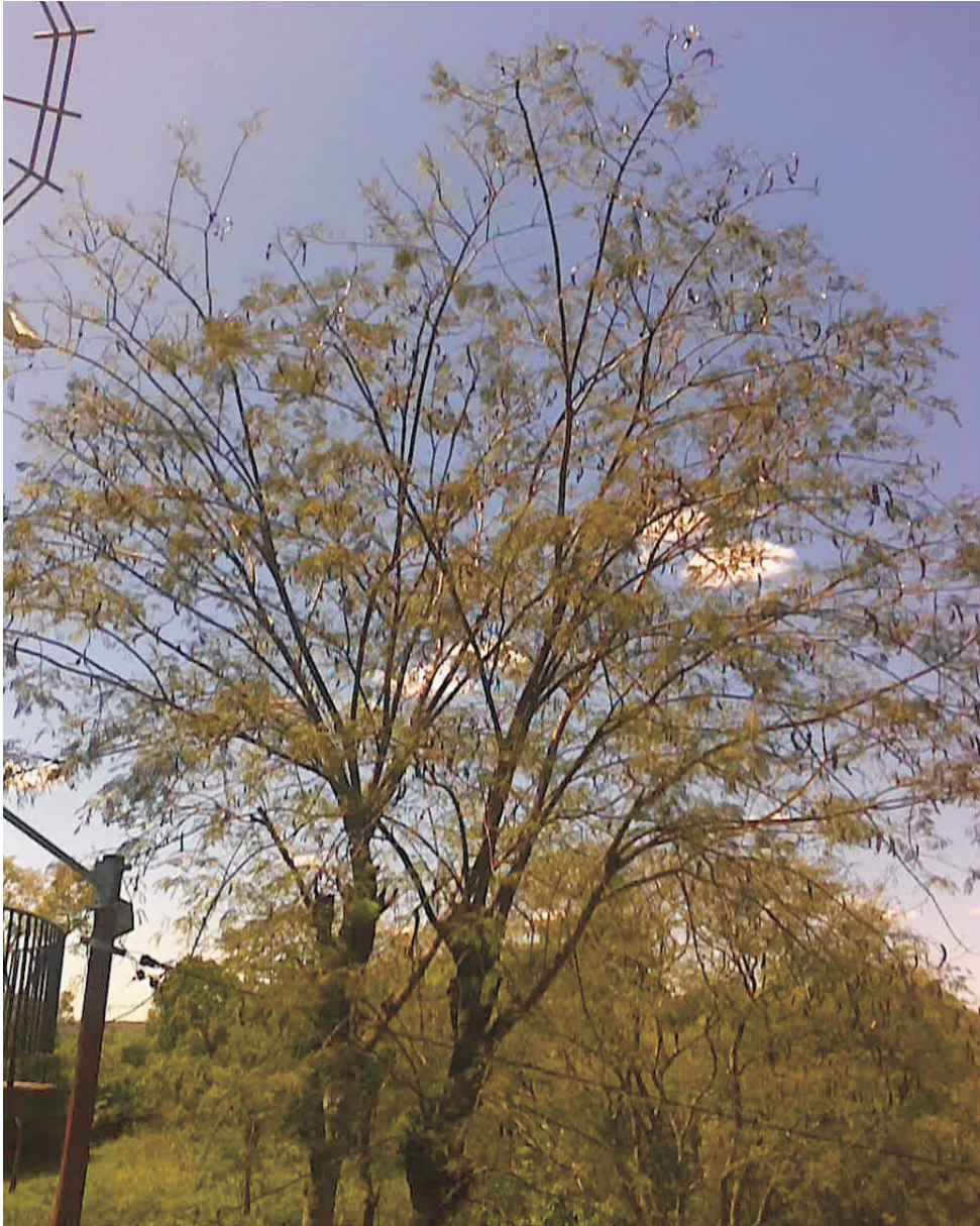
Foto 3: Anadenanthera colubrina en San Bernardino (Dpto. Cordillera)