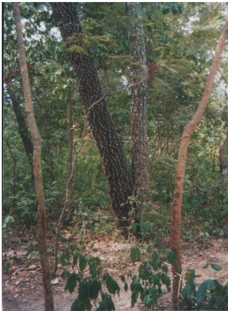
Foto 2: Anadenanthera colubrina y Astronium urundeuva creciendo juntos en un bosque de la Ecorregión Aquidabán (Dpto. Concepción)